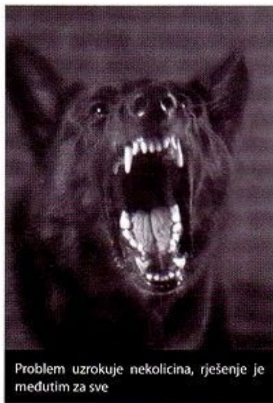
Problem uzrokuje nekolicina, rješenje je međutim za sve

trolize koji crpi energiju iz atmosfere, a to je posljednja stvar za koju bi iluminatske energetske kompanije željele da postane dostupna javnosti.